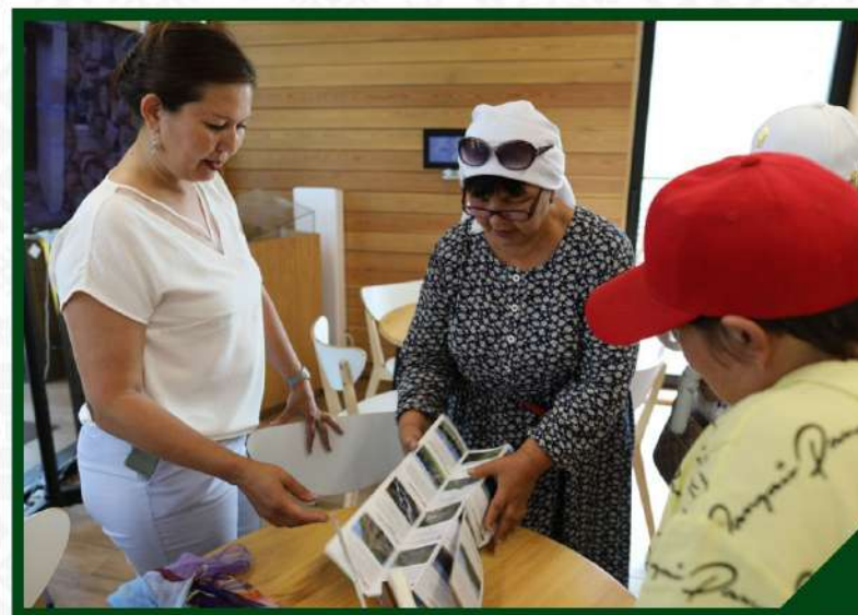
ЭТНОГРАФИЧЕСКАЯ ЭКСПЕДИЦИЯ В ИШЕМБАЙСКИЙ И МЕЛЕУЗОВСКИЙ РАЙОНЫ