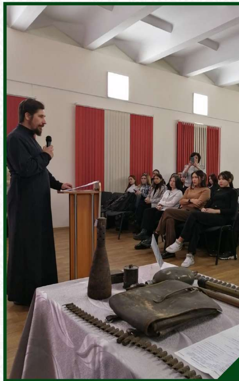
ВЫЕЗДНОЕ МЕРОПРИЯТИЕ «УРОК НРАВСТВЕННОСТИ». СОШ №12. 16 МАРТА