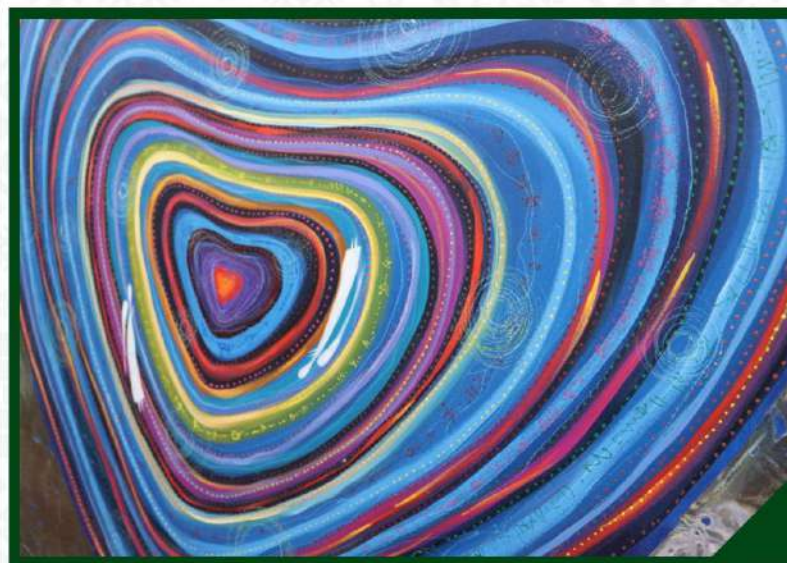
МАСТЕР-КЛАСС ОТ ВАЛЕРИЯ ИВАНОВА (ВАЛЕРИУС) ПО АВТОРСКОЙ ТЕХНИКЕ «ЦАРАПКИ». 17 ФЕВРАЛЯ