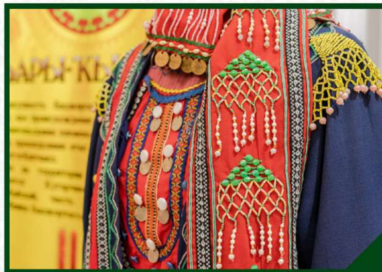
ОТКРЫТИЕ ВЫСТАВКИ «МИРАС» (НАСЛЕДИЕ) В НАЦИОНАЛЬНОМ МУЗЕЕ МАРИЙ ЭЛ ИМ.Т.ЕВСЕЕВА Г.ЙОШКАР-ОЛА . 15 НОЯБРЯ