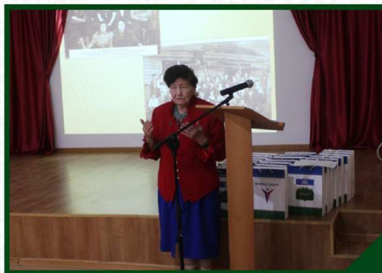
МЕРОПРИЯТИЕ ПО ЧЕСТВОВАНИЮ ВЕТЕРАНОВ «ДЕТИ ВОЙНЫ - ДЕТИ ПОБЕДЫ»