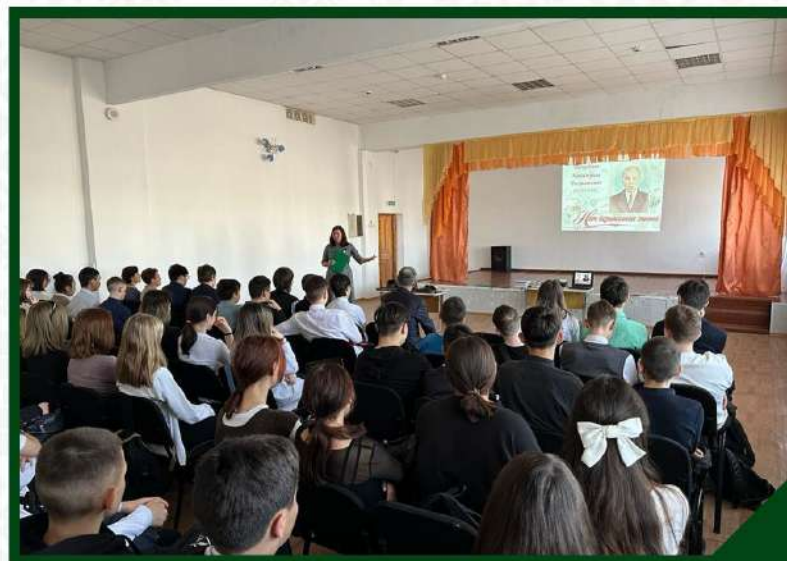
МУЗЕЙНИЙ УРОК "НЕТ БЕЗЫМЯННЫХ ГЕРОЕВ". АПРЕЛЬ