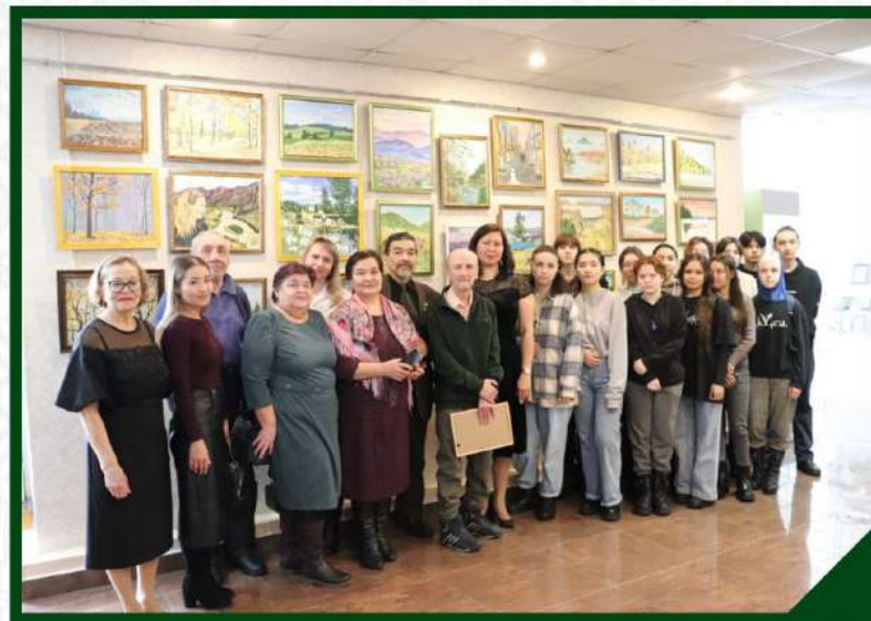
ВЫСТАВКА КАРТИН СИБАЙСКОГО ХУДОЖНИКА РИФА АХУНЬЯНОВА «С ЛЮБОВЬЮ О ГЛАВНОМ». 7 МАРТА