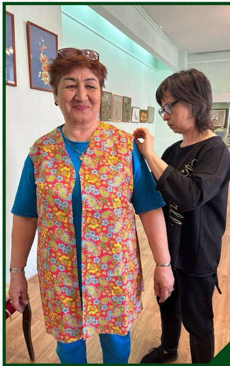
МАСТЕР-КЛАСС ПО ИЗГОТОВЛЕНИЮ КАМЗОЛА. 29 АПРЕЛЯ