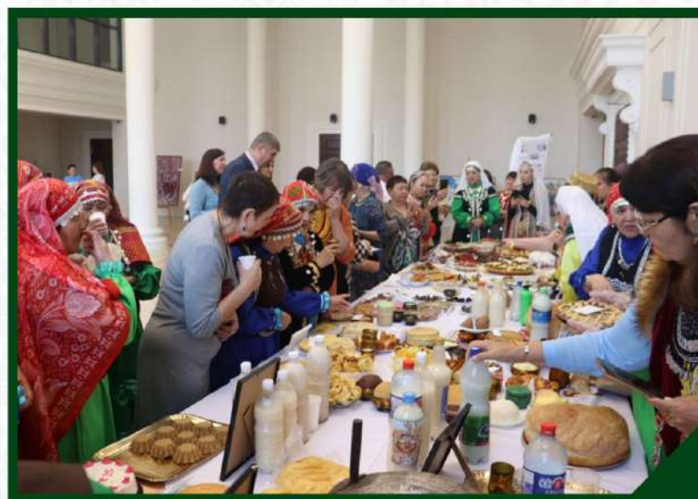
КОНКУРС-ВЫСТАВКА НАЦИОНАЛЬНЫХ БЛЮД НАРОДОВ РОССИИ «ТӘМЛЕ». 28 АПРЕЛЯ