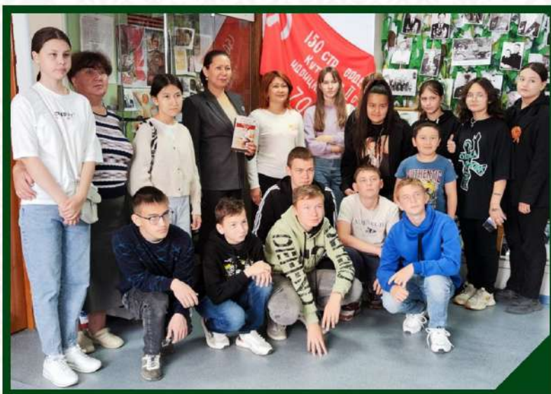
УРОК МУЖЕСТВА «ДЕНЬ ЗАЩИТНИКА ОТЕЧЕСТВА». ФЕВРАЛЬ