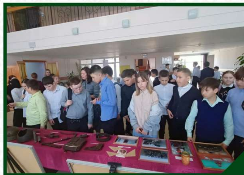
ПЕРЕДВИЖНАЯ ВЫСТАВКА «ГЕРОИ И ПОДВИГИ»