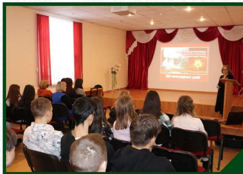
РЕСПУБЛИКАНСКАЯ АКЦИЯ «БЛОКАДНЫЙ ХЛЕБ», ЯНВАРЬ