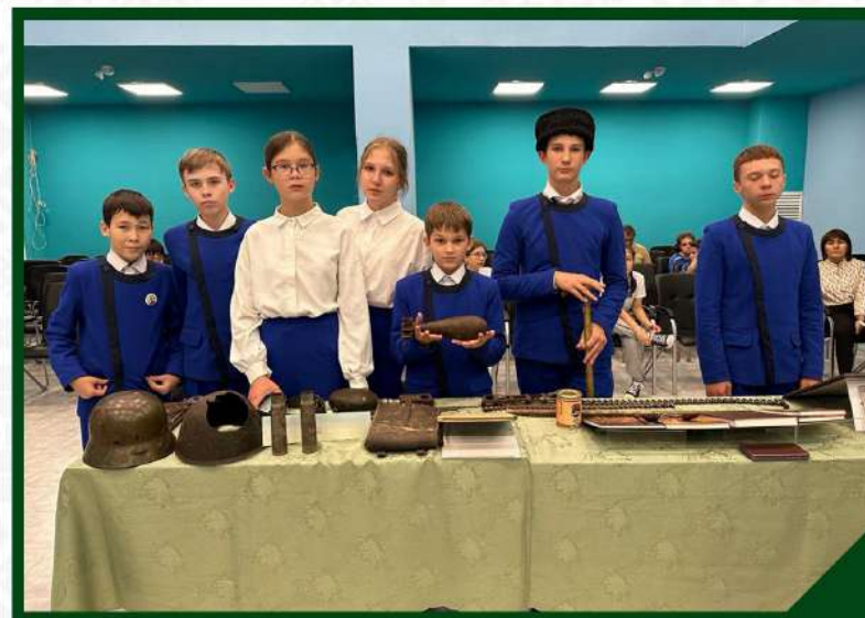
УРОК МУЖЕСТВА «ЛЕГЕНДАРНЫЙ ГЕНЕРАЛ» ДЛЯ КЛАССОВ ИМЕНИ ГЕРОЯ РОССИЙСКОЙ ФЕДЕРАЦИИ ГЕНЕРАЛ-МАЙОРА МИНИГАЛИ ШАЙМУРАТОВА. 27 СЕНТЯБРЯ