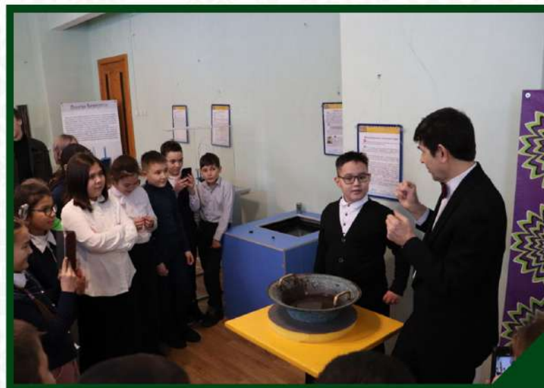
ВЫСТАВКА «ЖИВАЯ МЕХАНИКА» ИЗ ДОМА ЗАНИМАТЕЛЬНЫХ НАУК "ИНТЕЛЛЕКТУС" Г.УФЫ С 12 ЯНВАРЯ ПО 17 ФЕВРАЛЯ