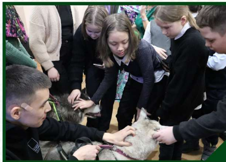
ВЫСТАВКА «МЫС СВЯЩЕННОЙ СОБАКИ» ИЗ МУЗЕЯ ПРИРОДЫ И ЧЕЛОВЕКА Г.ХАНТЫ-МАНСИЙСК С 26 ЯНВАРЯ ПО 21 ФЕВРАЛЯ