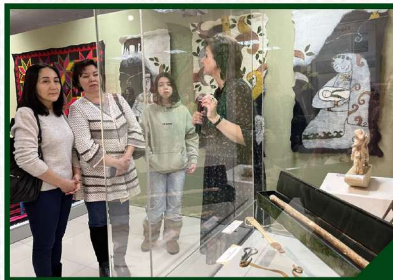
ВЫСТАВКА «МИРАС» (НАСЛЕДИЕ) В МУЗЕЙНОМ РЕСУРСНОМ ЦЕНТРЕ Г.НОВАБЬСЬК ЯНАО. 29 ЯНВАРЯ