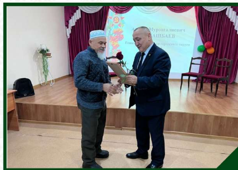
"У ВОЙНЫ НЕ ЖЕНСКОЕ ЛИЦО", ПОСВЯЩЕННОЕ ДНЮ ГЕРОЕВ ОТЕЧЕСТВА И ИСТОРИИ КЛУБА «ФРОНТОВЫЕ ПОДРУГИ». 8 ДЕКАБРЯ