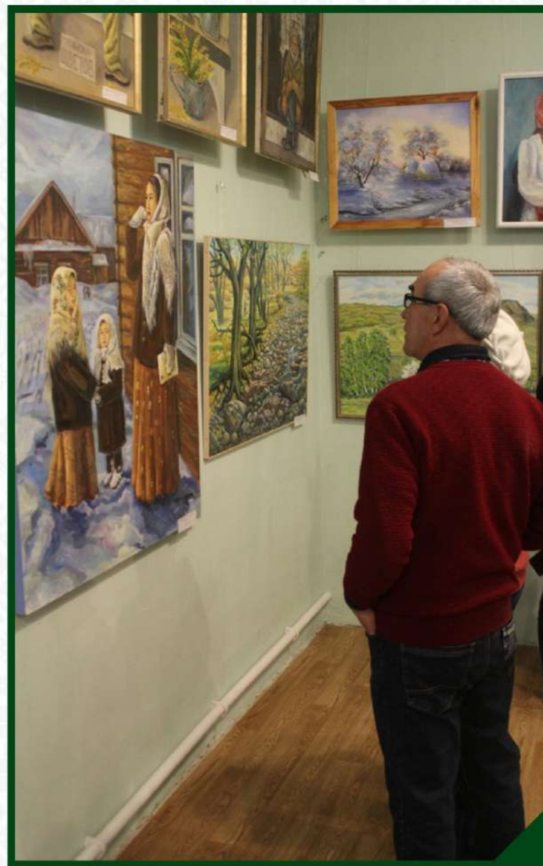
ВЫСТАВКА ХУДОЖЕСТВЕННЫХ РАБОТ «АРТ - ПАРАД» ПРЕПОДАВАТЕЛЕЙ-МАСТЕРОВ СИБАЙСКОГО КОЛЛЕДЖА ИСКУССТВ И ИХ УЧЕНИКОВ. ПОСВЯЩЕННАЯ ГОДУ ПЕДАГОГА И НАСТАВНИКА. 1 НОЯБРЯ