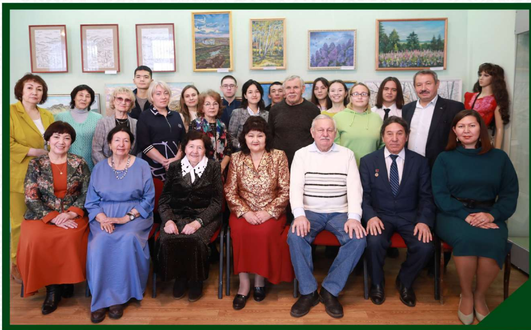
ПОДВЕДЕНИЕ ИТОГОВ КОНКУРСА «НА МАШИНЕ ВРЕМЕНИ – К ИСТОРИИ ПЕЧАТИ» В РАМКАХ РЕСПУБЛИКАНСКОГО ПРОЕКТА «АТАЙСАЛ». 24 НОЯБРЯ